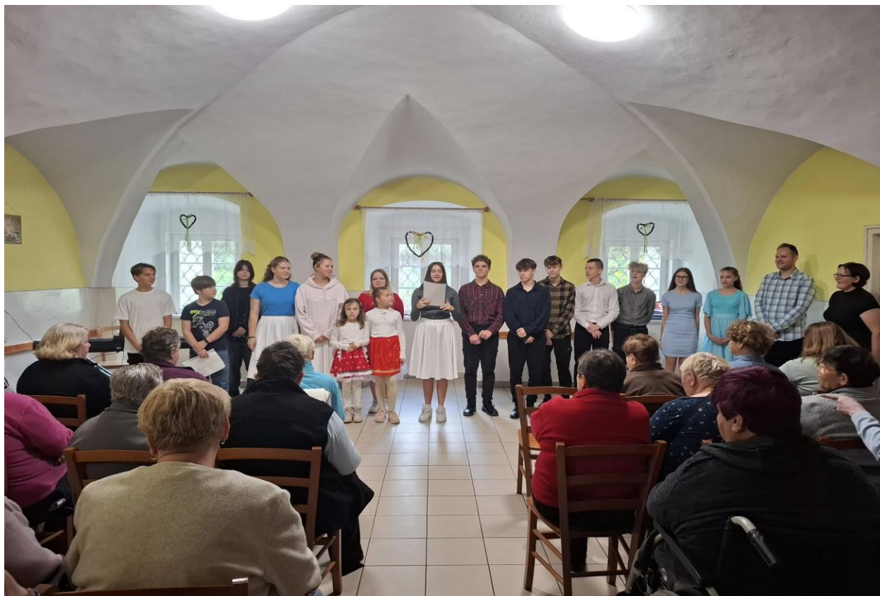
Mesiac úcty k starším – vystúpenie žiakov zo Spojenej školy v Bošáci