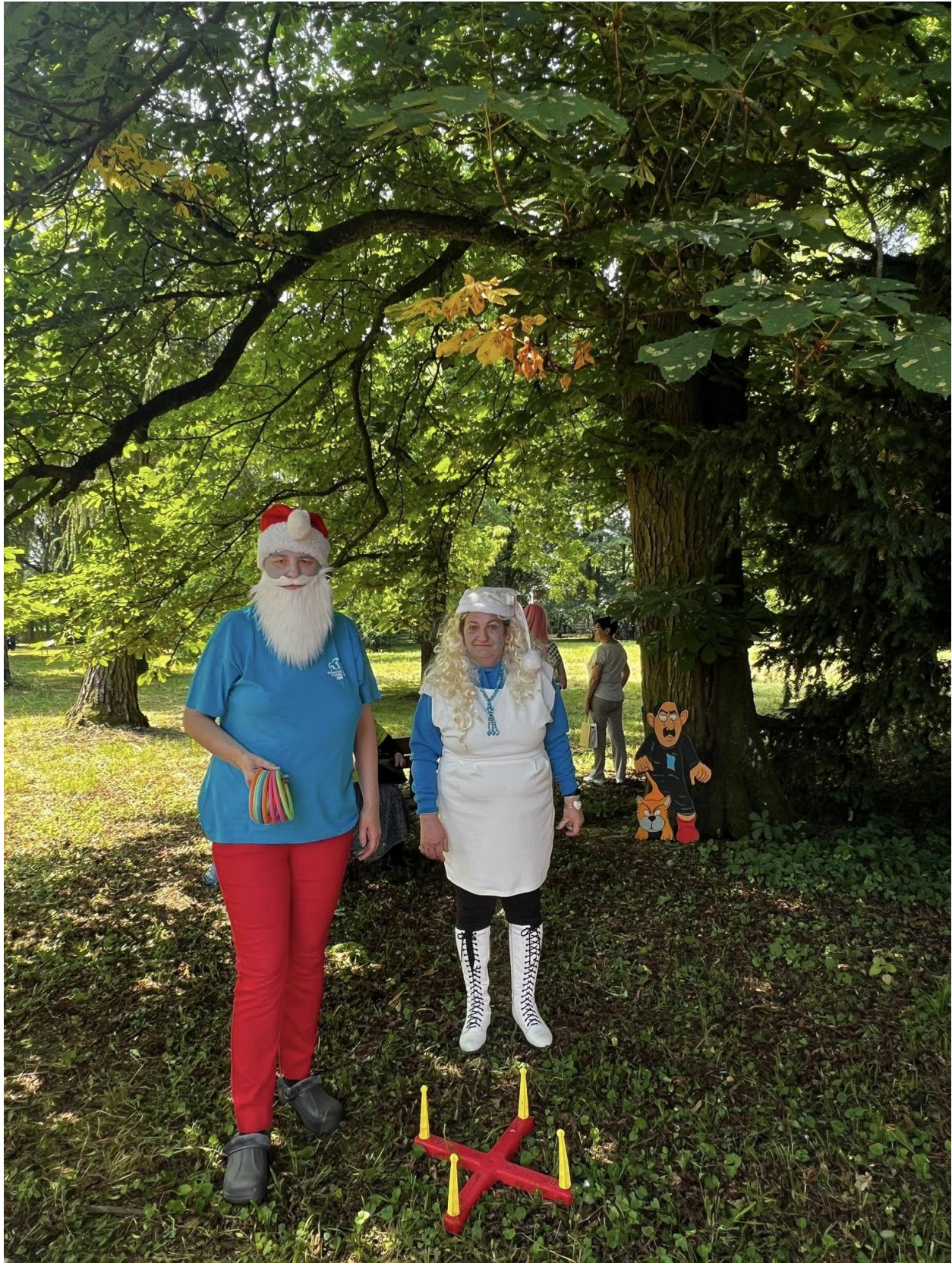
Cesta rozprávkovým lesom