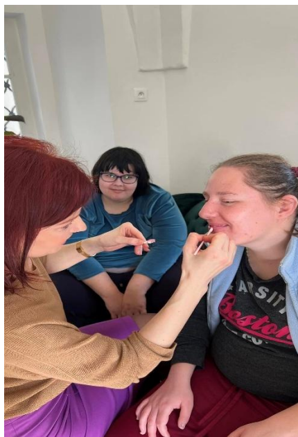
Beauty Day- MDŽ