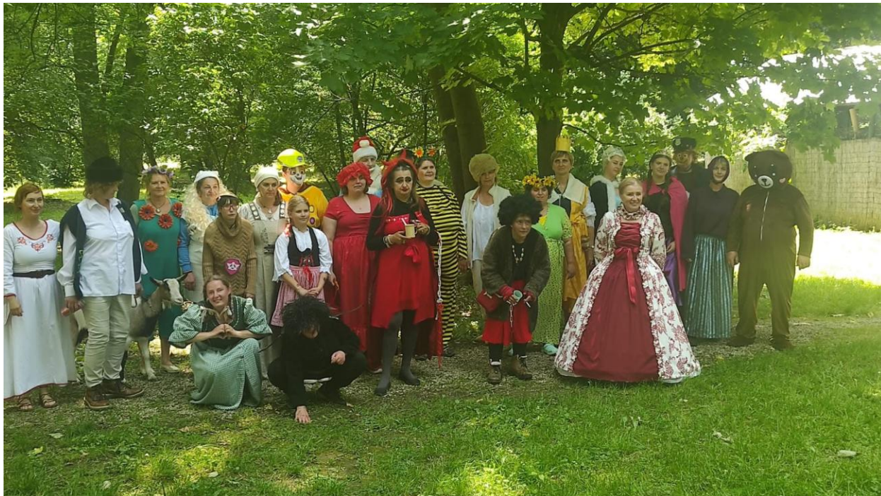
Cesta rozprávkovým lesom