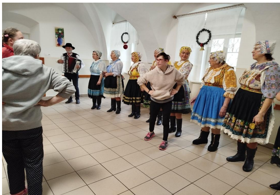
Pásmo kolied s FS POVOJA