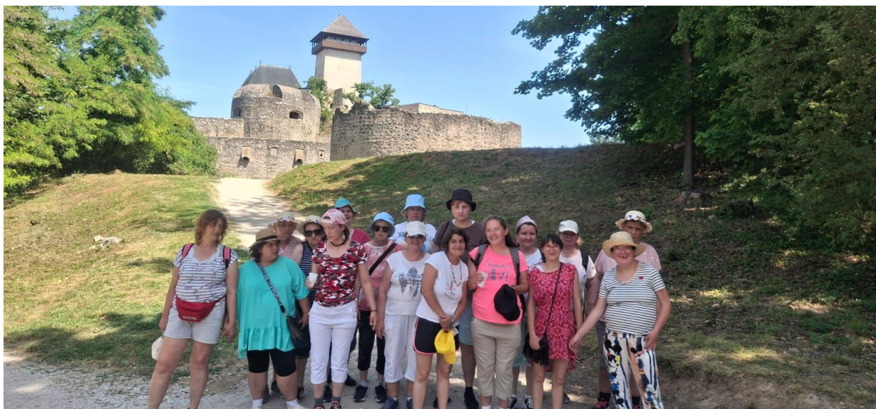
Výlet do Skalky nad Váhom a Trenčína