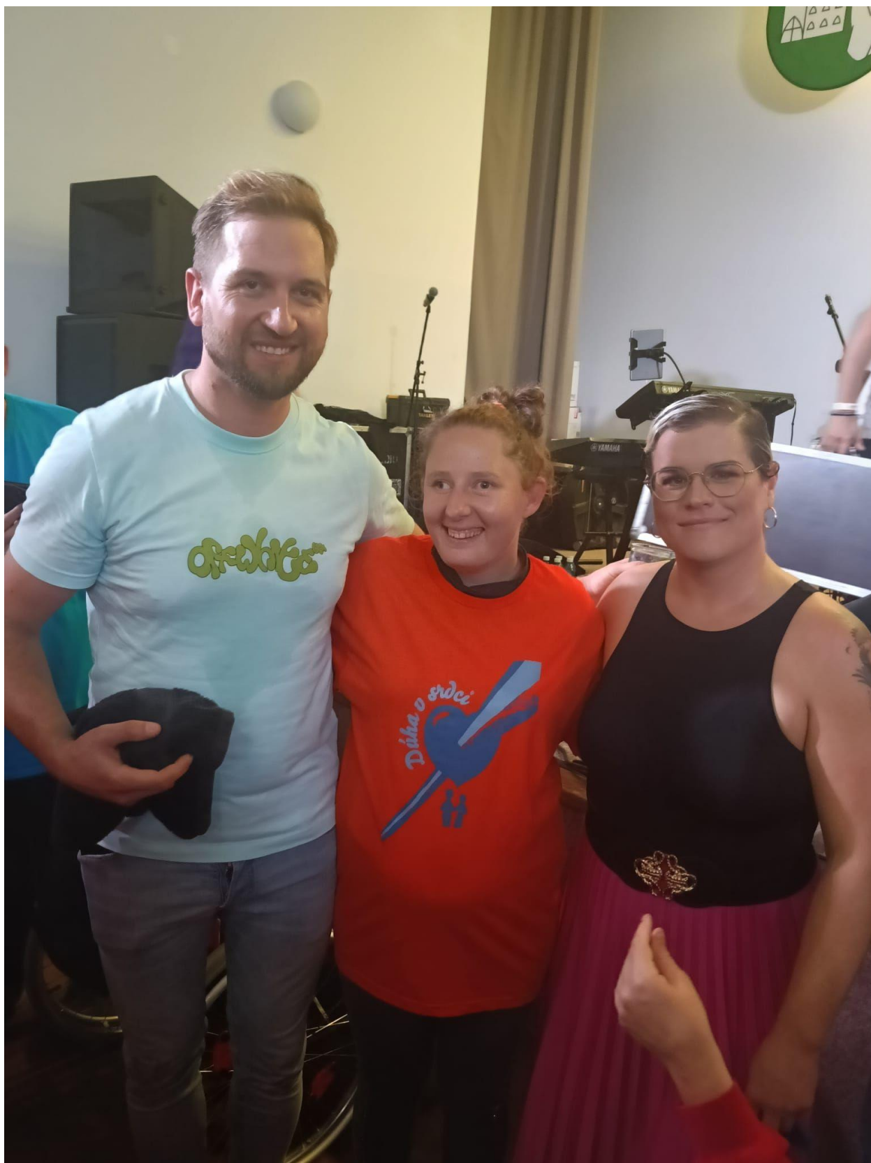
„Důhá v srdci“ 2025