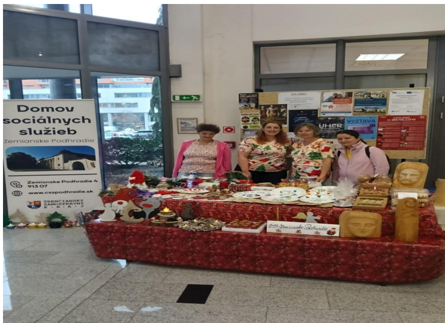
Vianočné trhy TSK