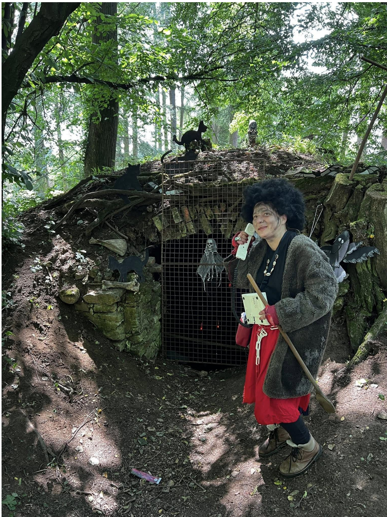
Cesta rozprávkovým lesom